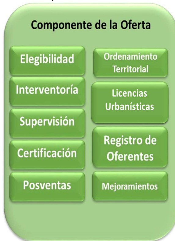
Ilustración 1. Componente de la Oferta - SISFV