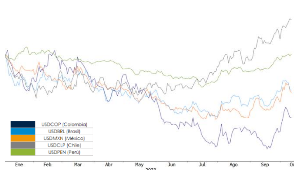
Gráfico 2. Var. Año Corrido Monedas LATAM

Las monedas latinoamericanas presentaron un comportamiento mixto durante la semana del 16 al 20 de octubre, siendo el peso chileno la moneda más valorizada (+0,46%), seguido del real brasileño (+0,13%), el peso colombiano (+0,07%), y el peso argentino (+0,03%). Por el contrario, las monedas que se devaluaron frente al dólar fueron el sol peruano (-0,46%) y el peso mexicano (-1,93%). Referente a la semana del 23 de octubre, las monedas de la región se han valorizado en promedio +0,25%, a excepción del peso mexicano que presenta una caída de -0,47%.