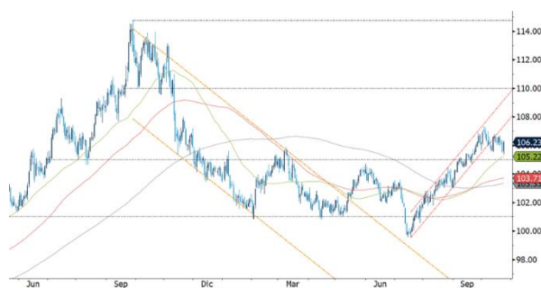
Gráfico 1. Comportamiento Índice DXY

Adicionalmente, Jerome Powell, presidente de la Reserva Federal (Fed), resaltó que la fortaleza de la economía estadounidense y la rigidez en el mercado laboral podría necesitar un mayor endurecimiento de la política monetaria para poder controlar la inflación.