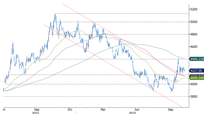
Gráfico 3. Comportamiento USDCOP

En línea con el comportamiento internacional, el USDCOP durante la semana anterior presentó un comportamiento lateral, entre el mínimo de $4.172,22 y el máximo de $4.275, con una volatilidad de $102,78 y una variación semanal de 0,07%. En las jornadas del 23 al 24 de octubre, el par continúa lateral, cerrando en $4.217.