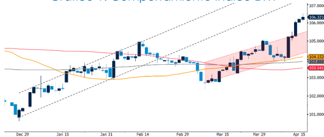
Gráfico 1. Comportamiento Índice DXY

El par EUR/USD mostró un comportamiento bajista, operando en promedio en $US 1,069. La decisión sobre los tipos de interés del Banco Central Europeo (BCE) influenciaron el comportamiento del par. Como lo anticipaba el mercado, el BCE mantuvo estable sus tasas de política monetaria. Así, la tasa de interés de las operaciones principales de financiación, de la facilidad marginal de crédito y de la facilidad de depósito se mantuvieron sin variación en 4,50%, 4,75% y 4,00%, respectivamente. La entidad, señaló que consideran apropiado un recorte en su próxima reunión de junio siempre y cuando estén seguros de que las presiones en los precios se hayan estabilizado. Christine Lagarde, presidenta del BCE, reafirmó esta posición al indicar que, de no haber una sorpresa importante en la inflación, se dirigen a moderar la política monetaria restrictiva que tienen.