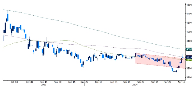
Gráfico 3. Comportamiento USDCOP

El par USDCOP operó durante la semana al alza, oscilando en un rango entre $3.787,17 y $3.953, con un valor promedio de $3.871,46. El par se vio afectado por la incertidumbre en los mercados internacionales lo que ha llevado a un incremento en el riesgo país, medido a través de los CDS a 5 años que han tenido una subida de 24 pbs durante la semana. Durante la semana, el USDCOP rompió la tendencia bajista que tenía desde octubre del 2023, donde alcanzó a llegar a niveles no vistos desde abril del 2022. Durante la jornada del 17 de abril, el par retornó a niveles por debajo del $3.900 ante el continuo ingreso de flujos para el pago de impuestos de grandes contribuyentes y las presiones alcistas sobre los precios de las materias primas podría generar volatilidad en el par operando entre $3.850 y $3.950.